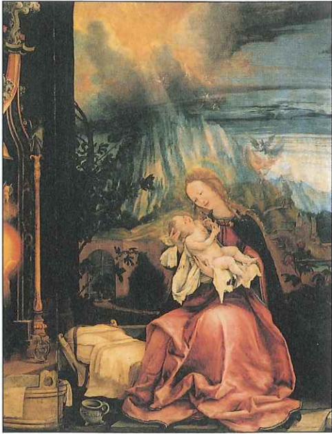
Madonna z Dzieciątkiem (1512-1516) Matthias Grünewald (szczegół ołtarza z Isenheim)